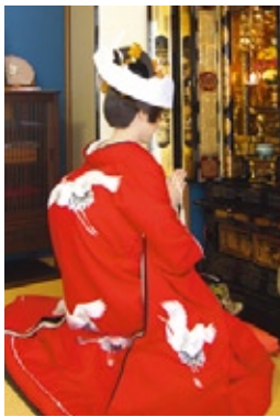
嫁ぐ日の「仏壇参り」も金沢ならではの大切なしきたりである。