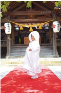
宇多須神社の挙式は、趣きもあり、厳格な中にも温かい式が叶う。