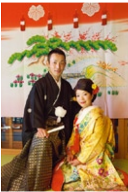
今、テレビで話題の「花嫁のれん」も金沢の婚礼に欠かせない伝統。