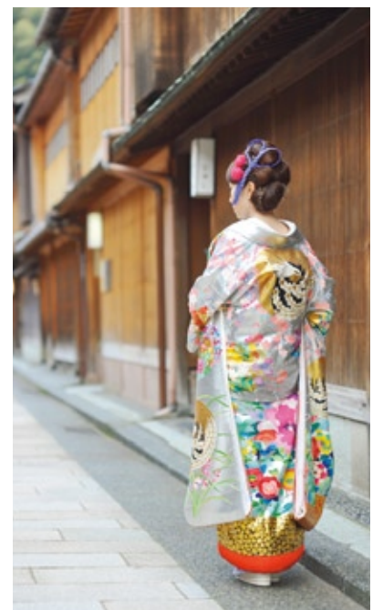
花嫁衣装の柄を繊細に描く「金沢祝言こぼし」は、思い出の一品として両親へのプレゼントにも人気。