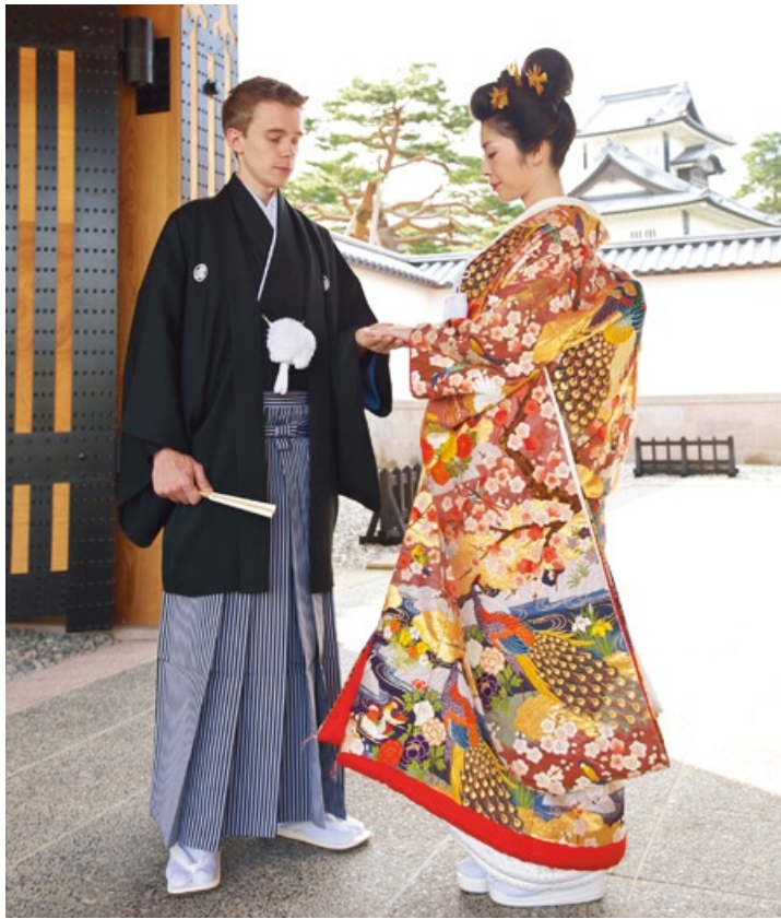
右/金沢城を背景にしたロケーションフォト。新郎はフランス人で、国際結婚のカップルにも人気となっている。自髪で結った、やまと髪がクラシカル。左上/晴れが美しい婚礼に抵抗があるカップルには、“盛装”ではなく“和正装”での和婚が叶う。左下/東茶屋街のお練り花嫁行列は、抒情的。