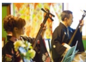
かげ笛や三味線の演出も可能 華やかな琴や舞、情緒ある笛や三味線の演奏、民謡の演出も希望に応じられる。