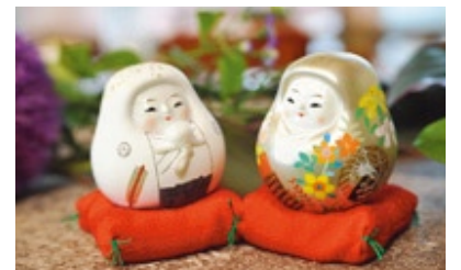
「金沢syugen」オリジナル「金沢祝言こぼし」も愛らしい。

など様々で、武家屋敷や金沢城跡でも叶う。また、「お水合わせ」「花嫁のれん」「仏壇参り」など、古き金沢の婚礼文化を今の時代に再現。「金沢syugen」ならではの様々な抒情的な演出は新鮮だ。そして、花嫁衣装の柄を描く「金沢祝言こぼし」や、「水引」を使ったブライヤカかんざしなど、オリジナル小物にも注目。また、モダンな美装コーディネートによる「街並ウエディングフォト」もおすすすめだ。