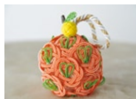
「金沢modern水引」 ブーケ、かんざし、ミニこも樽など、衣装に合わせてデザイン。写真は柚子手鞠。