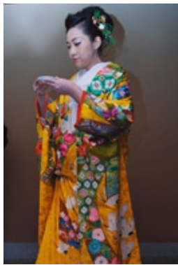
町家の玄関を婚家に見立て、両家の水を盃にそそぐ「お水合わせ」。