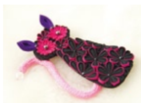
「金沢つまみ細工」のアクセサリ 京都の舞妓さんのかんざしを花嫁の個性に合わせてデザイン。写真は猫モチーフ。